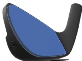
反発性能が高いMS300鍛造フェース