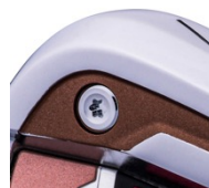
ヘッド内部に柔らかいポリマーA-5※を注入し、 非常にソフトな打感を実現 しました。

>フェース下部まで反発するL字鍛造マレージングフェース高弾道を可能にする深重心設計