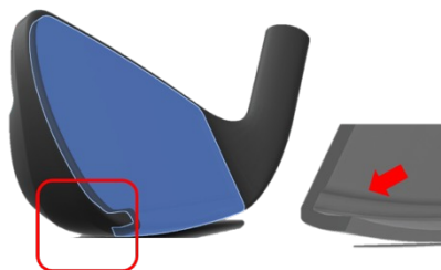
反発性能が高いMS300 Lプレス鍛造フェース L字に曲がったソール付近のフェース下部をさらに肉薄に設計

>フェース下部まで反発するL字鍛造マレージングフェース高弾道を可能にする深重心設計