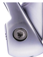
ヘッド内部に柔らかいポリマーA-5※を注入し、 非常にソフトな打感を実現 しました。