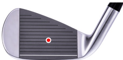
最大の飛びを実現する フェースセンター重心設計