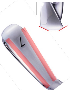
フェース、バック側を落としたダブルカットソール アドレス時の安定とインパクトの抜けを両立