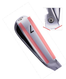
フェース、バック側を落としたダブルカットソール インパクトの抜けの良さを実現