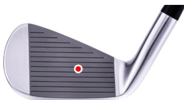
操作性を重視したホーズルの長さ ヒールより重心を意識させるスコアライン位置