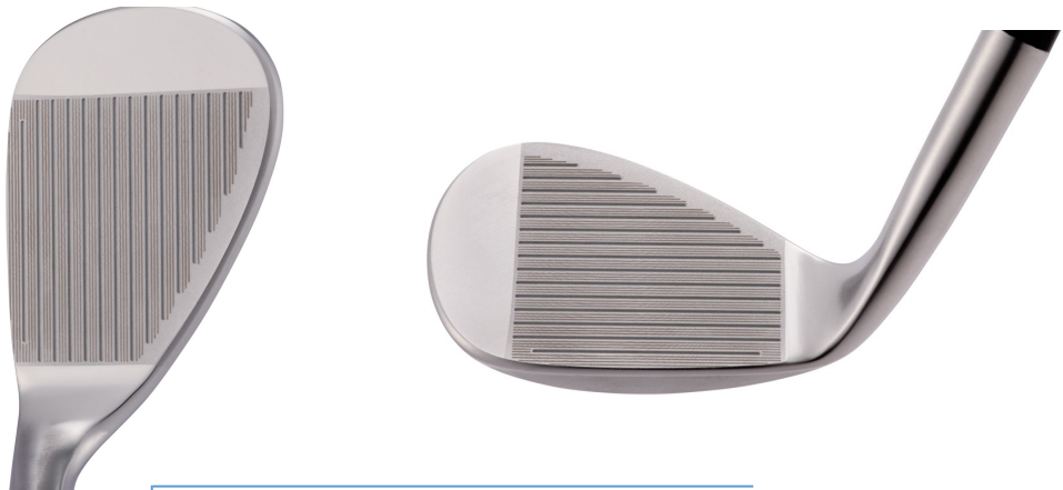
スクエアに構え易いオーソドックスなラウンド形状

>オーソドックスなフェース形状とトゥ、ヒールにかけて丸みを帯びた 抜け易いラウンドソール